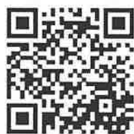
阿里山風景區 管理處官網

彩行程。亦首次與山美部落合作，於11月3日將在達娜伊谷展場演 辦理「muni 音樂會」活動，邀請阿里山各部落樂舞團體共襄盛舉， 展現鄒族音樂文化和特色。鄒年慶期間活動內容豐富，歡迎大家一起 到阿里山部落旅行。