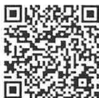
阿里山 新印象 line@