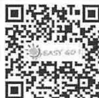
阿里山 easy go (商品販售平台)