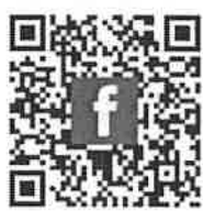
阿里山 新印象 粉絲專頁