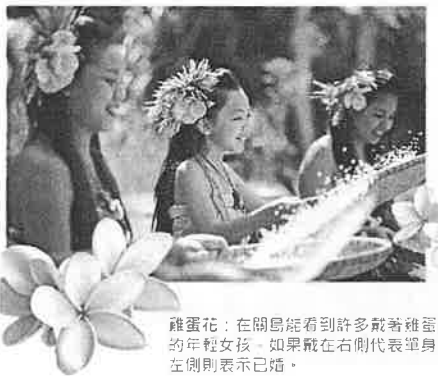
雞蛋花：在關島能見到許多戴著雞蛋花髮飾的年輕女孩。如果戴在右側代表單身，戴在左側則表示已婚。