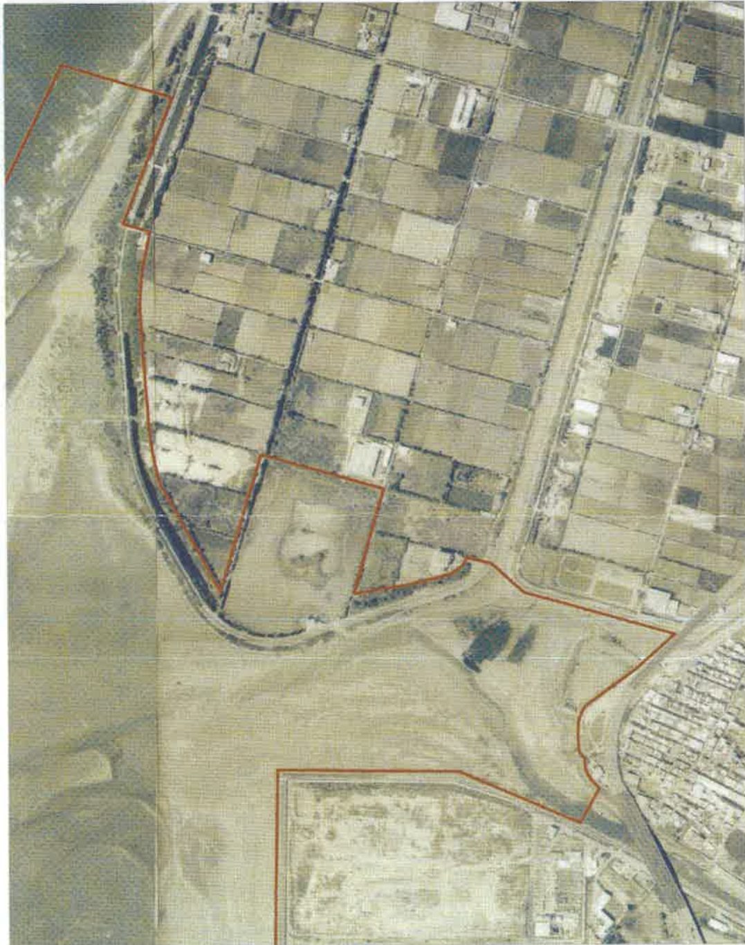
圖一之一：北界及客雅溪口